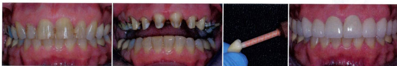
Abb. 1: Gesamtansicht eines Patienten vor der Behandlung. – Abb. 2: Präparationen. – Abb. 3: Einbringen von Maxcem™ Elite in Lava-Krone. – Abb. 4: Postoperative Gesamtansicht der zementierten Restaurationen.